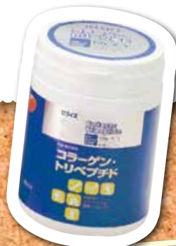
コラーゲン・トリペプチド